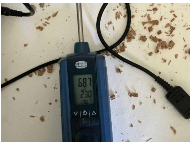
Bild 9: Invändigt, Entréplan, Fuktkontroll utförd under gränsvärde se bilaga 4