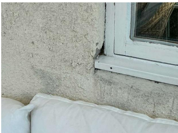
Bild 1: Utvändigt, Fönster, Viss otäthet noteras vid enstaka fönster