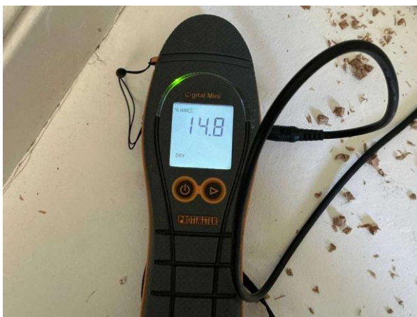
Bild 8: Invändigt, Entréplan, Fuktkontroll utförd under gränsvärde se bilaga 4