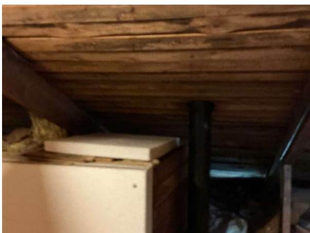
Bild 5: - Utvändigt, Vind, Huset är självdragsventilerat Lokalt noteras det mikrobiell påväxt samt fuktrosor...