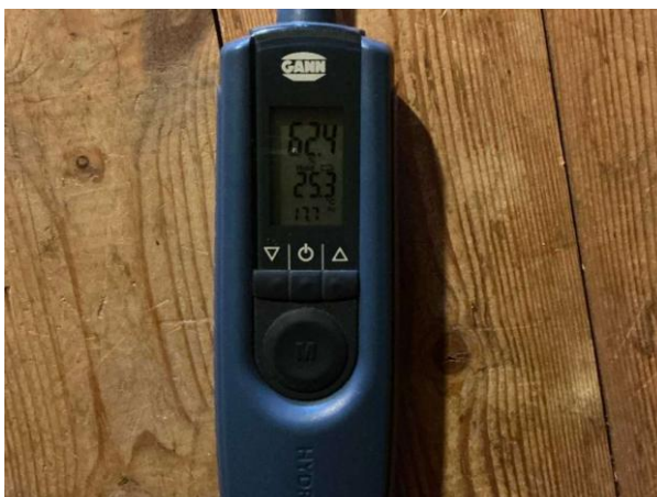
Bild 2: - Utvändigt, Vind, Fuktkontroll utförd under gränsvärde se bilaga 4