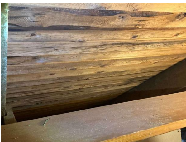
Bild 4: - Utvändigt, Vind, Huset är självdragsventilerat Lokalt noteras det mikrobiell påväxt samt fuktrosor.....