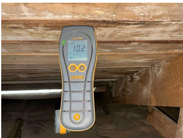
Bild 3: - Utvändigt, Vind, Fuktkontroll utförd under gränsvärde se bilaga 4