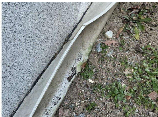
Bild 1: Utvändigt, Mark, Topplisten är synlig samt är markduken delvis trasig (bör skyddas med tex singel)